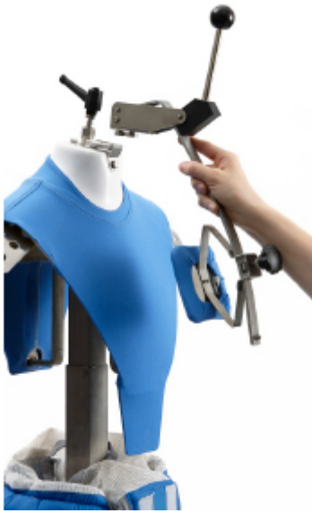
Pala fermacollo removibile