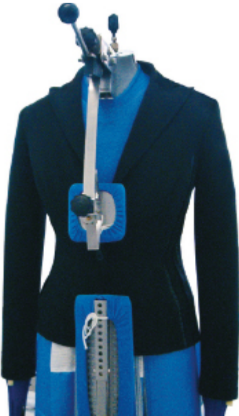
Permette di stirare taglie piccole o giacche da donna sciancrate