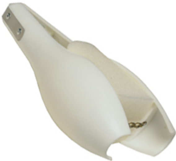
Espansori per il fondo manica