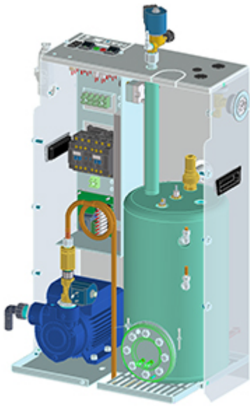
Caldaia 4 kW incorporata ad alimentazione automatica con pompa